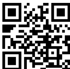
Lyceum Club Internazionale Firenze