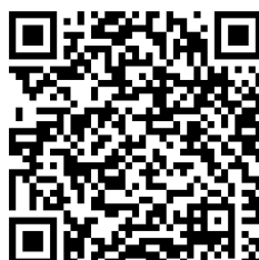
Centro di Documentazione sulla Musica Americana Prato